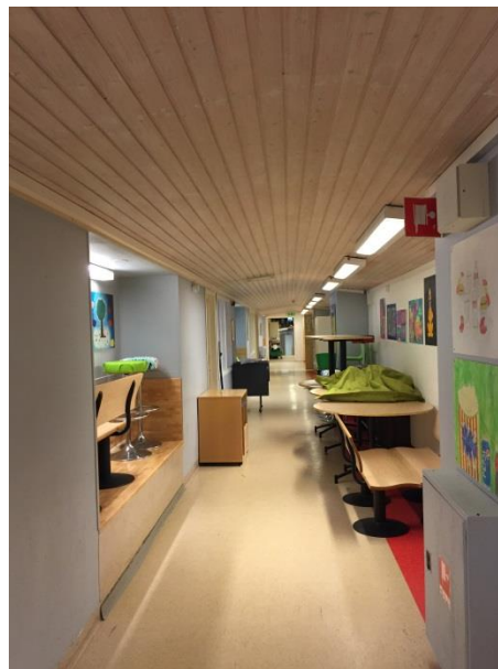
Korridor med inbyggd soffa.