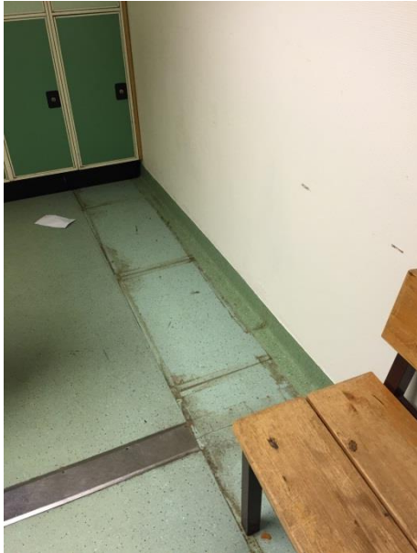
Matta under borttagna skåp i korridor.