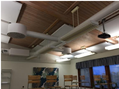
Armaturer i klassrum samt bullerdämpande akustikplattor ovan installationer.