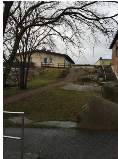
Grusad backe/slänt behöver handikappanpassas.