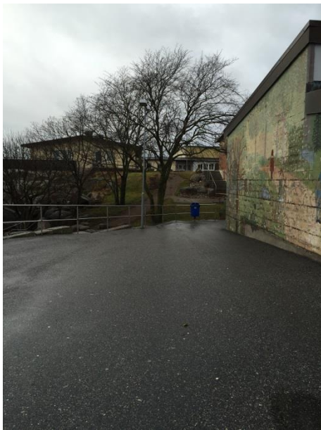
Handikappanpassning gångstråk mot matsal/hantverkshuset. Klottrad fasad.