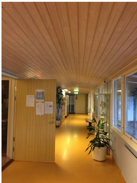
Korridor utan ljudabsorbenter.