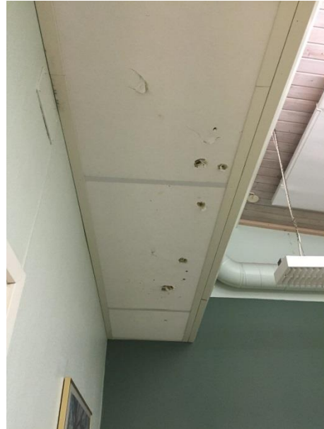
Trasigt undertak i klassrum.