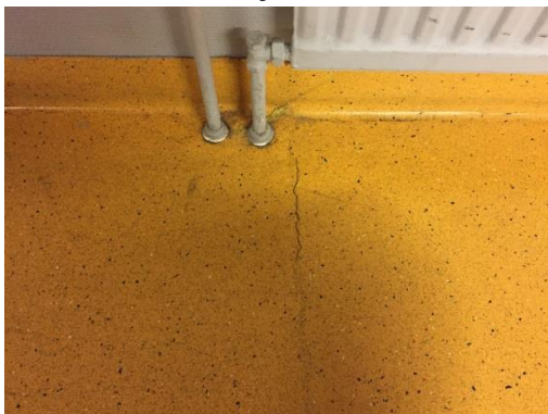
Sprickor i plastmatta i korridor.