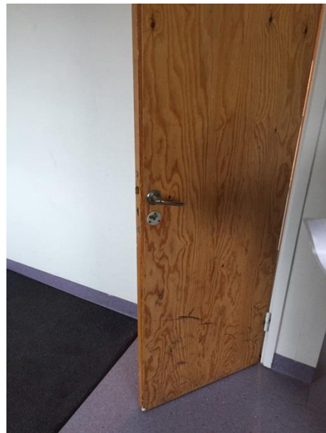
Dörr till elevtoalett.