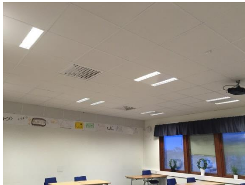
"Pilotprojekt" i ett klassrum med nytt undertak (akustikplattor) och armaturer.