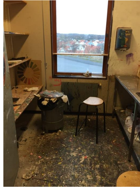
Målarverkstad i träslöjdsal.