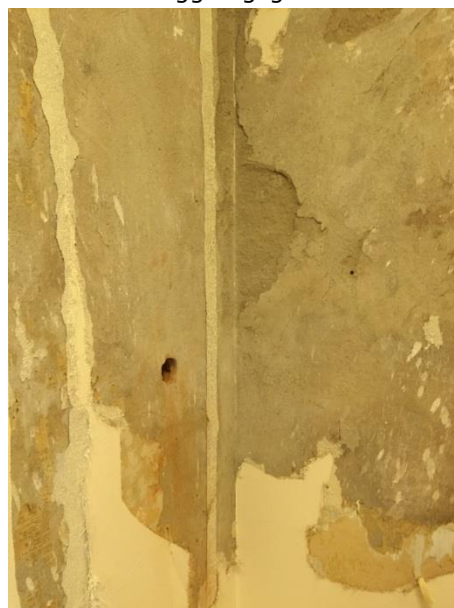
Skador yttervägg och hål efter provtagning.