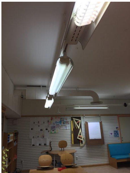
Synliga installationer i tak.