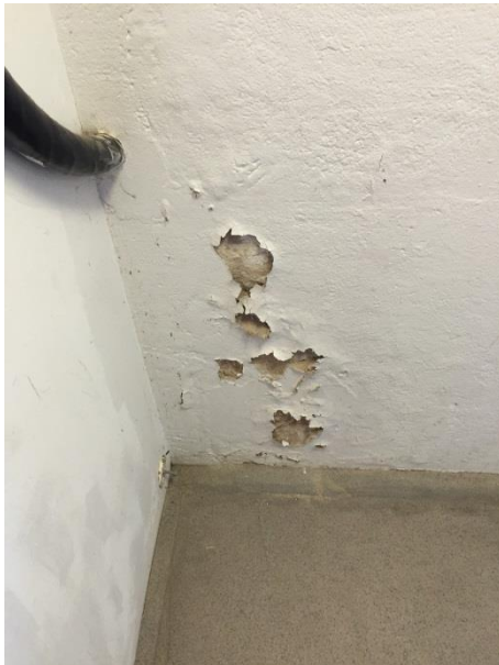
Skador/färg lossnar yttervägg.