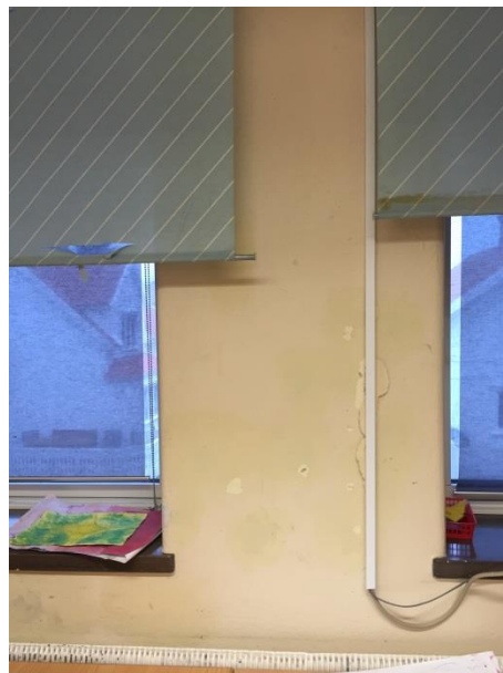
Sprickor på yttervägg och trasiga mörkläggningsgardiner.