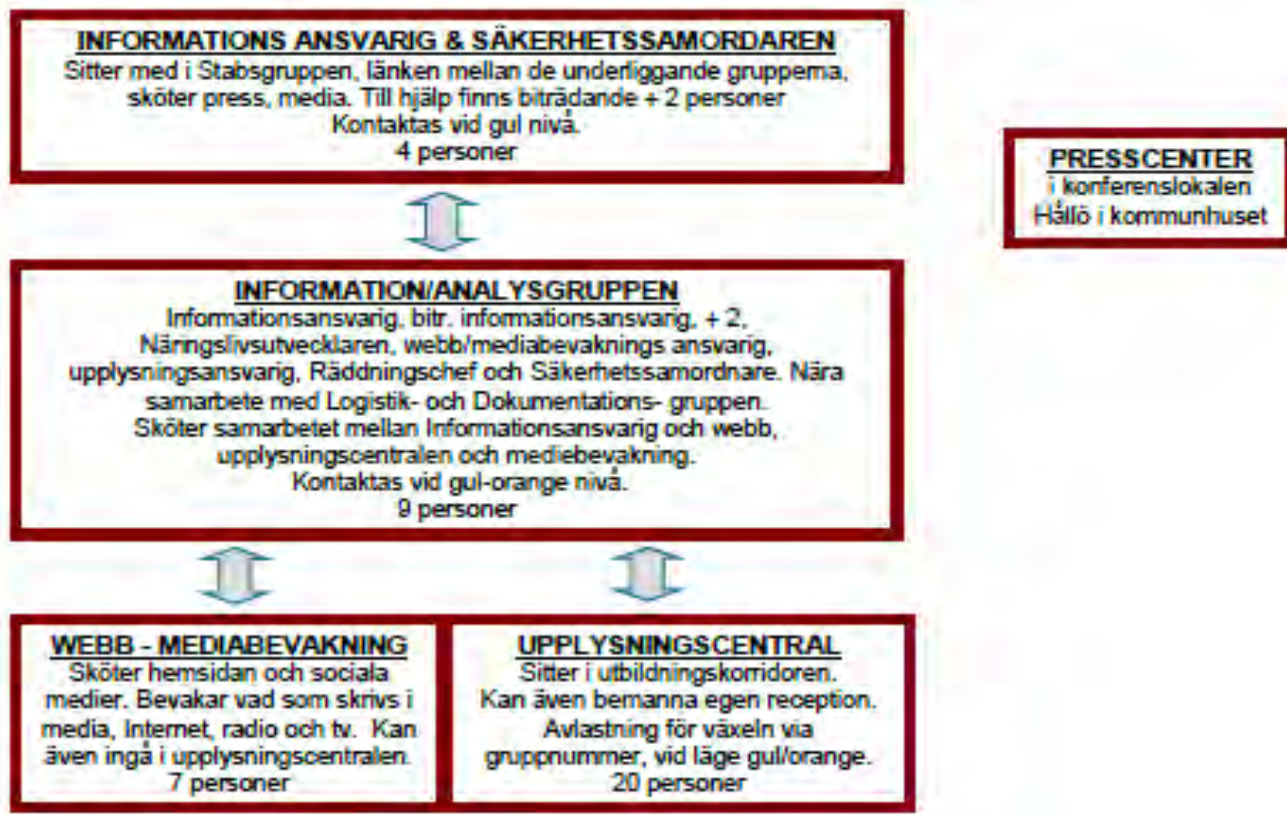
Översikt Stabservice organisation