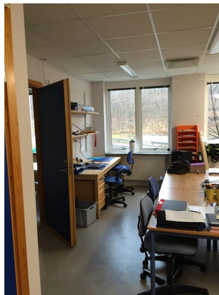
Trånga arbetsrum för personalen.