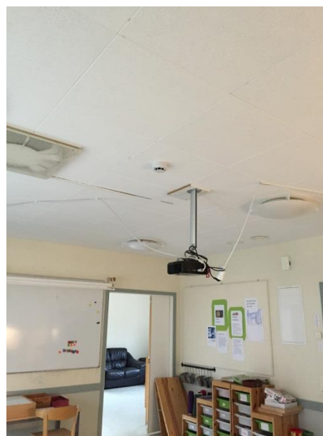
Delar av fritids/6-årsverksamhets lokaler har dåliga ljudabsorbenter eller saknar helt bullerdämpning.