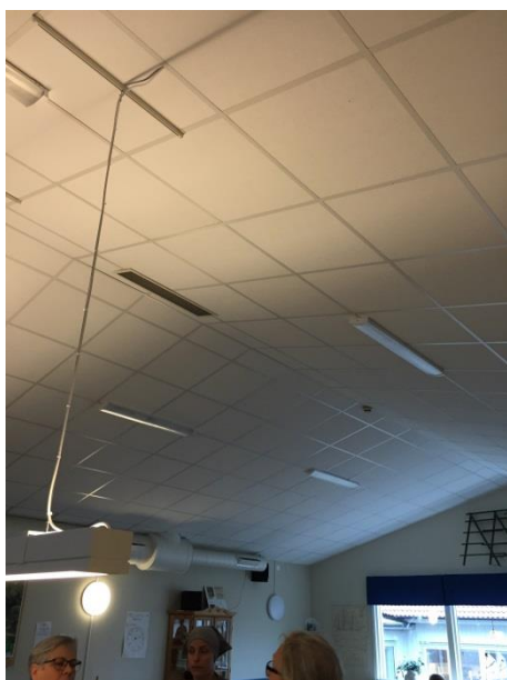
Ljudabsorbenter i matsal fungerar undermåligt.