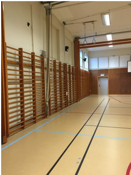
Ribbstolar i gymnastiksal är uttjänade.