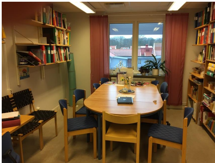
Arbetsrum fungerar även som mötesrum.