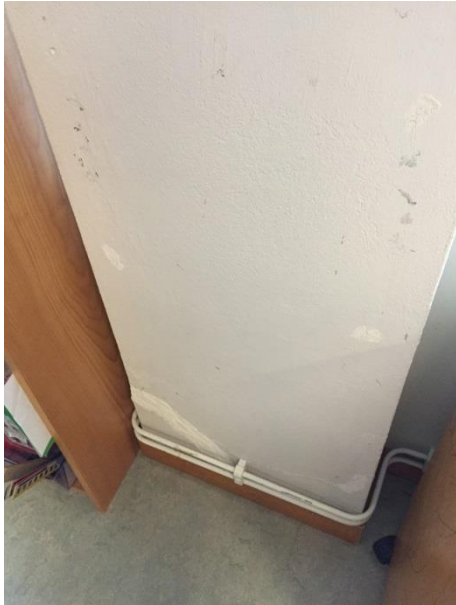
Skador/sprickor yttervägg i klassrum.