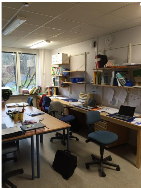
Trånga arbetsrum för personalen.