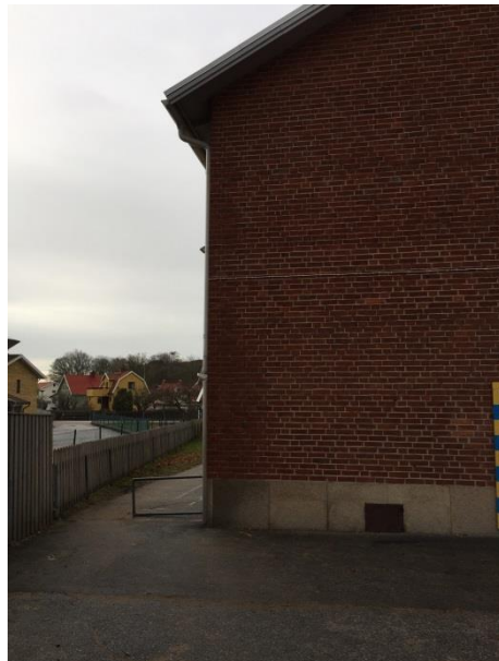
Fuktgenomslag tegelvägg på gymnastiksalen.