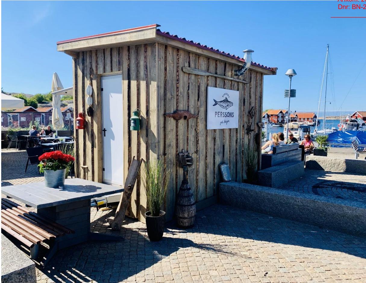
Vagnen sedd snett bakifrån.