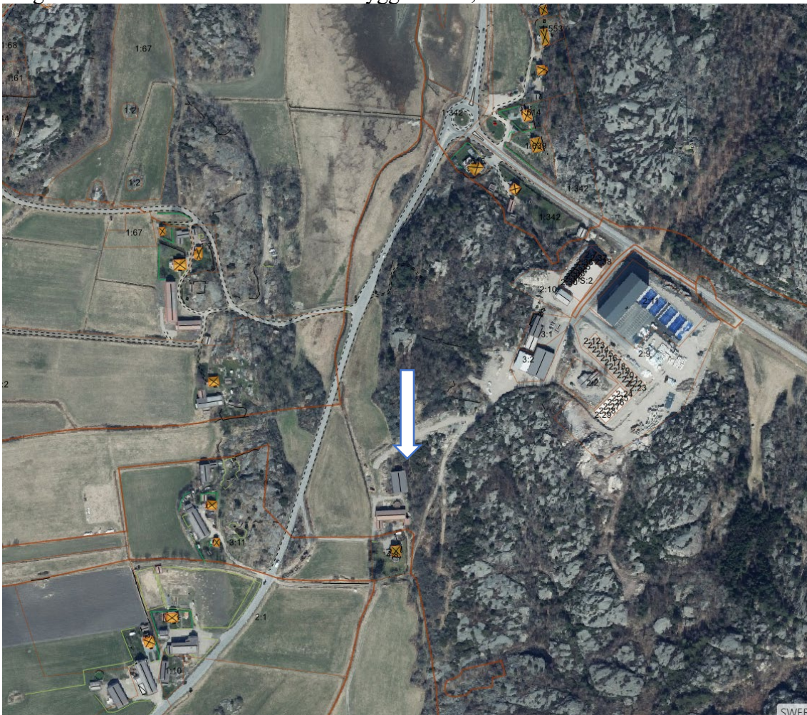
Område - Ödby Nedergård

Frågor besvaras av Susanna Mäki alt. Byggenheten, som nås via växel 0523-66 40 00.